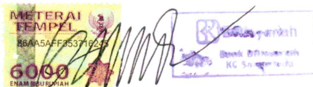
Zulhaidir Pimpinan Cabang